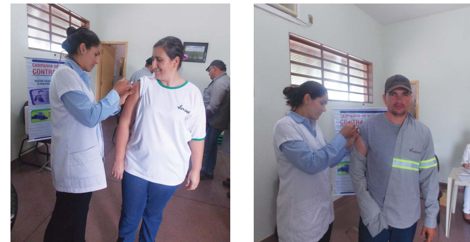
Colaboradores recebendo a aplicação da vacina contra a gripe

A vacina da gripe também está disponível na rede pública para crianças de 6 meses a 5 anos, maiores que 60 anos, profissionais de saúde, portadores de doenças crônicas, gestantes e mulheres que tiveram filho recentemente. E, neste ano, segundo o Ministério da Saúde, professores das redes pública e privada passam a fazer parte do público-alvo. O médico ainda ressalta que a vacinação é o método mais eficaz de se prevenir contra a gripe. Porém, há algumas contra indicações: as pessoas com alergia comprovada ao ovo não devem receber a vacina. Quem está com imunodepressão, natural ou medicamentosa, deve receber orientações específicas do próprio médico.